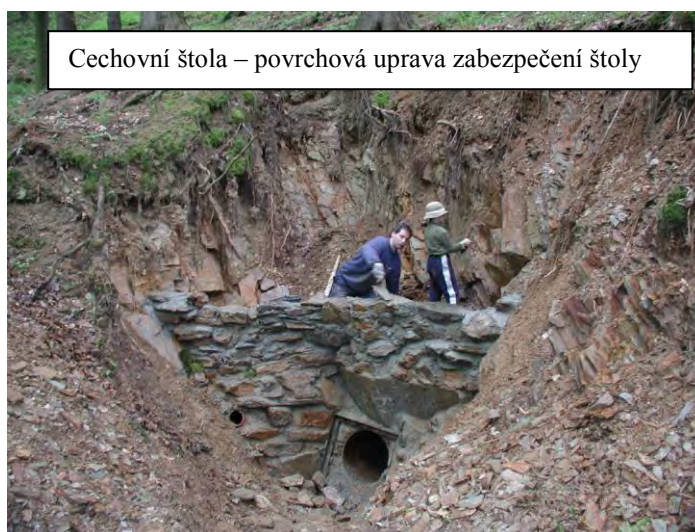
Cechovní štola – povrchová uprava zabezpečení štoly