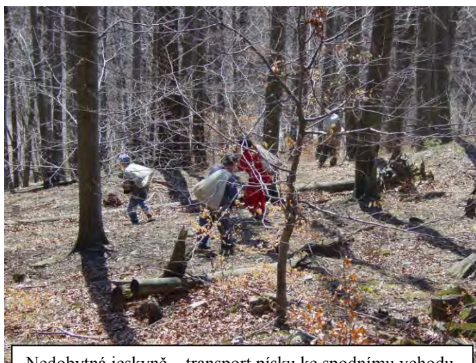
Nedobytná jeskyně – transport písku ke spodnímu vchodu