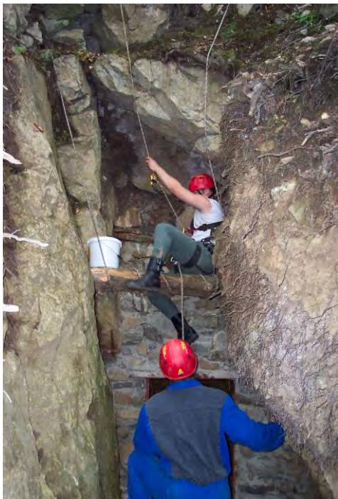
Nedobytná jeskyně – zaberzpečení spodního vchodu.

Při kontrole účetnictví a vyúčtování dotace z Ekofondu města Liberec za rok 2003 nebyla shledána žádná závažná závada. Byl podán návrh na vytvoření aktuálního seznamu maletku a odepsání všech ostatních položek, které nebudou uvedené v tomto seznamu (dosud je evidován materiál, nářadí a OPP starší i víc než 20, které jsou už dávno za svou životností).